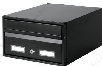
c/1 face ref. 4700