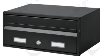
c/1 face ref. 4500