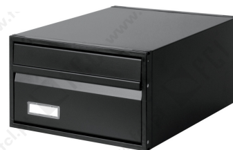
c/2 faces ref. 4800