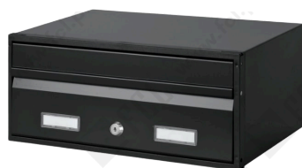
c/1 face ref. 4500