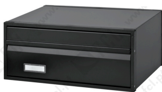
c/2 faces ref. 4600