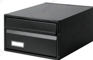
c/2 faces ref. 4800